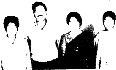
म सचाये श्री सा तृतीय पुत्री ला आता चो र्णे व ग्नेप नी अमय चो र्णे व नका र्तिवा